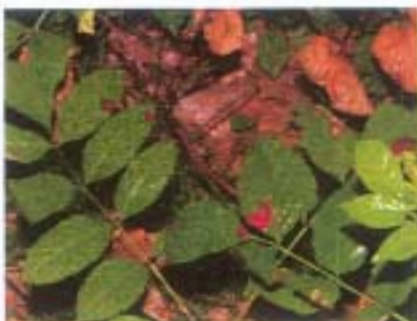
Les gouttes de sang ne sont pas toujours visibles à l'œil nu.

Dans sa nouvelle version, le Blue Star est présenté sous forme de cachets contenus dans un papier d'aluminium. Ils sont rapidement solubles et permettent de préparer la solution facilement. Une gourde ou de l'eau issue d'une flaque suffisent pour remplir le petit pulvérisateur.