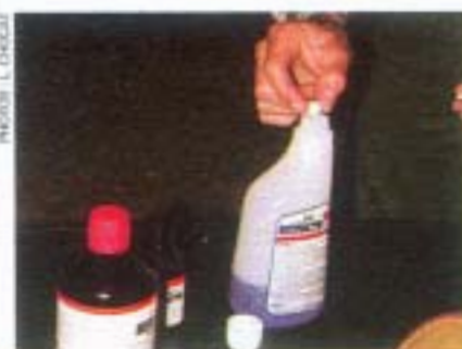
Le matériel nécessaire est peu encombrant et assez peu onéreux.