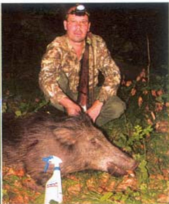
Test réussi ce soir-là, mais ce sanglier, lui, il saignait... élément capital pour ce produit!

quand il y a du sang... C'est logique peut-être, mais nous sommes loin des propos polémiques tenus lors de la sortie de ce révélateur de sang.